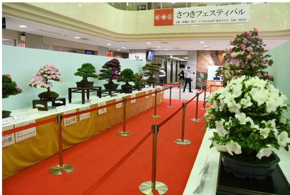
〈今年のさつきフェスティバルの様子〉

令和8年5月 第71号(年2回発行) 編集・発行:板橋区農業委員会 電話 3938-5114