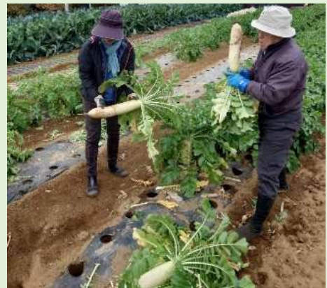
〈農のサポーターによる大根の収穫補助の様子〉