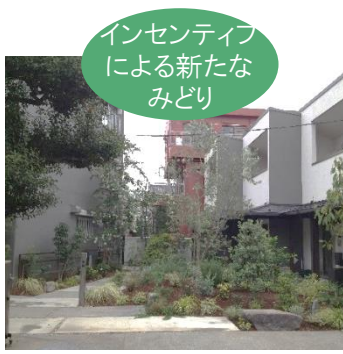
インセンティブ による新たな みどり