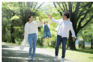
公園などの オープンスペース