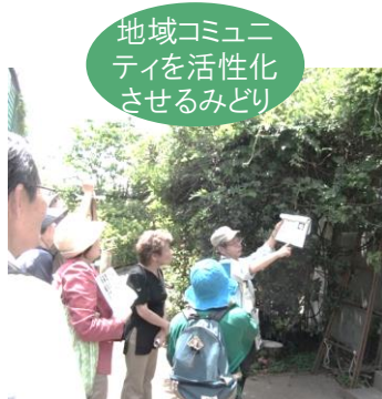
地域コミュニ ティを活性化 させるみどり

○次期「板橋区基本構想」や「板橋区基本計画」の計画期間と整合を図り、令和 8（2026）年度から令和 17（2035）年度までの 10 年間とする。