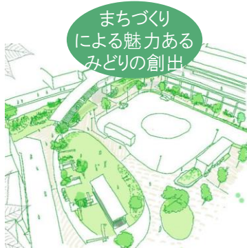
まちづくり による魅力ある みどりの創出