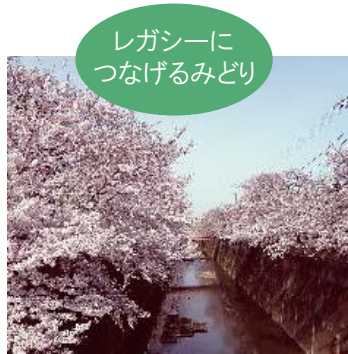
レガシーに つなげるみどり