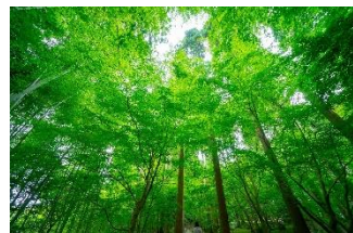
樹林や樹木などの植物