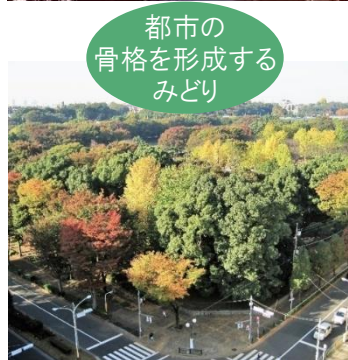
都市の 骨格を形成する みどり