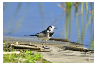
河川の水辺や鳥などの 自然要素