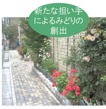
新たな担い手 によるみどりの 創出