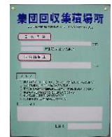
プレート 縦 50cm×横 40cm または B4 サイズ (約 37 cm×26.5 cm)