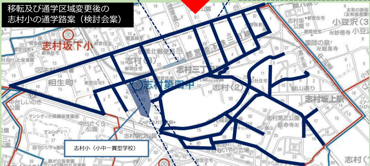
移転及び通学区域変更後の志村小の通学路案（検討会案）