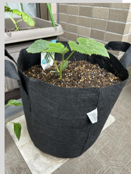
画像は昨年参加者のレポートより