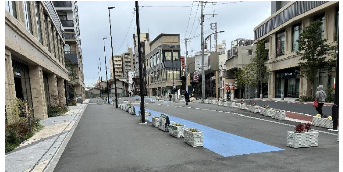
補助第26号線暫定整備地