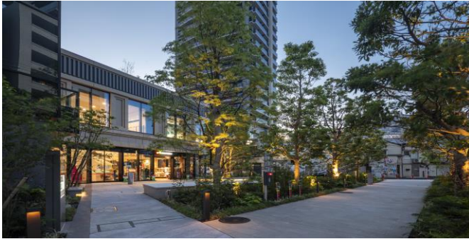
クロスポイント再開発で整備された広場