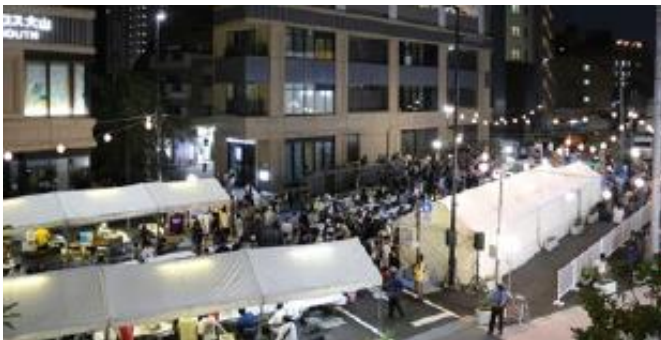
公共空間を活用した実証実験(R7.8.24)