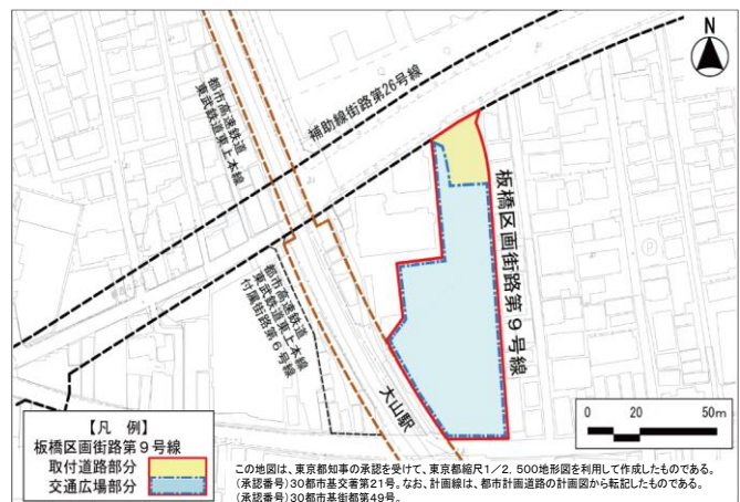
大山駅の駅前広場

なお、東京都が事業主体で進めている連続立体交差事業は、令和6年11月に東武鉄道が工事説明会を開催し、現在、準備工事に着手している。