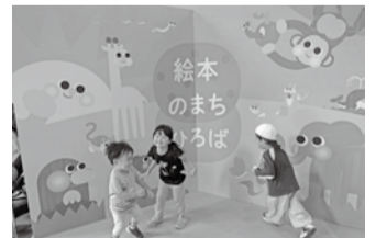
「絵本のまち板橋」の取組

ほかにも「さわる絵本」の普及や、絵本のプレゼント事業などで創造都市の取組や「絵本のまち板橋」をさらに推進していきます。ぜひ多くの方々に絵本を通じた様々な体験や交流を楽しんでいただけたら幸いです。