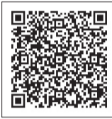
▲詳しくはこちらから

まで、往復はがき・電子申請(区ホームページ参照)で、郷土資料館(〒175-0092赤塚5-35-25)※申込記入例(8面)参照