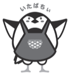
食育キャラクター

様々な経験を通じて「食」に関する知識とバランスの良い「食」を選択する力を習得し、健全な食生活を実践できる人を育てることです。